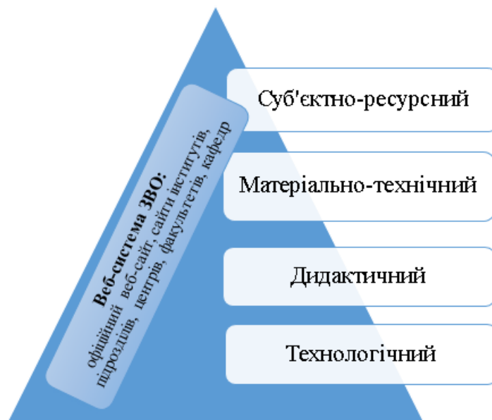
Рис. 1. Інформаційно-освітнє середовище ЗВО

Наприклад, у ВНЗ Укоопспілки «Полтавський університет економіки і торгівлі» (ПУЕТ) прикладами таких ЕНМКД є розроблені викладачами дистанційні курси за допомогою сервісу https://sites.google.com/ . На рисунку 2 зображено головну сторінку такого дистанційного курсу, який є класичним прикладом ЕНМКД для вивчення дисципліни «Інформаційні системи та технології в галузях економіки».