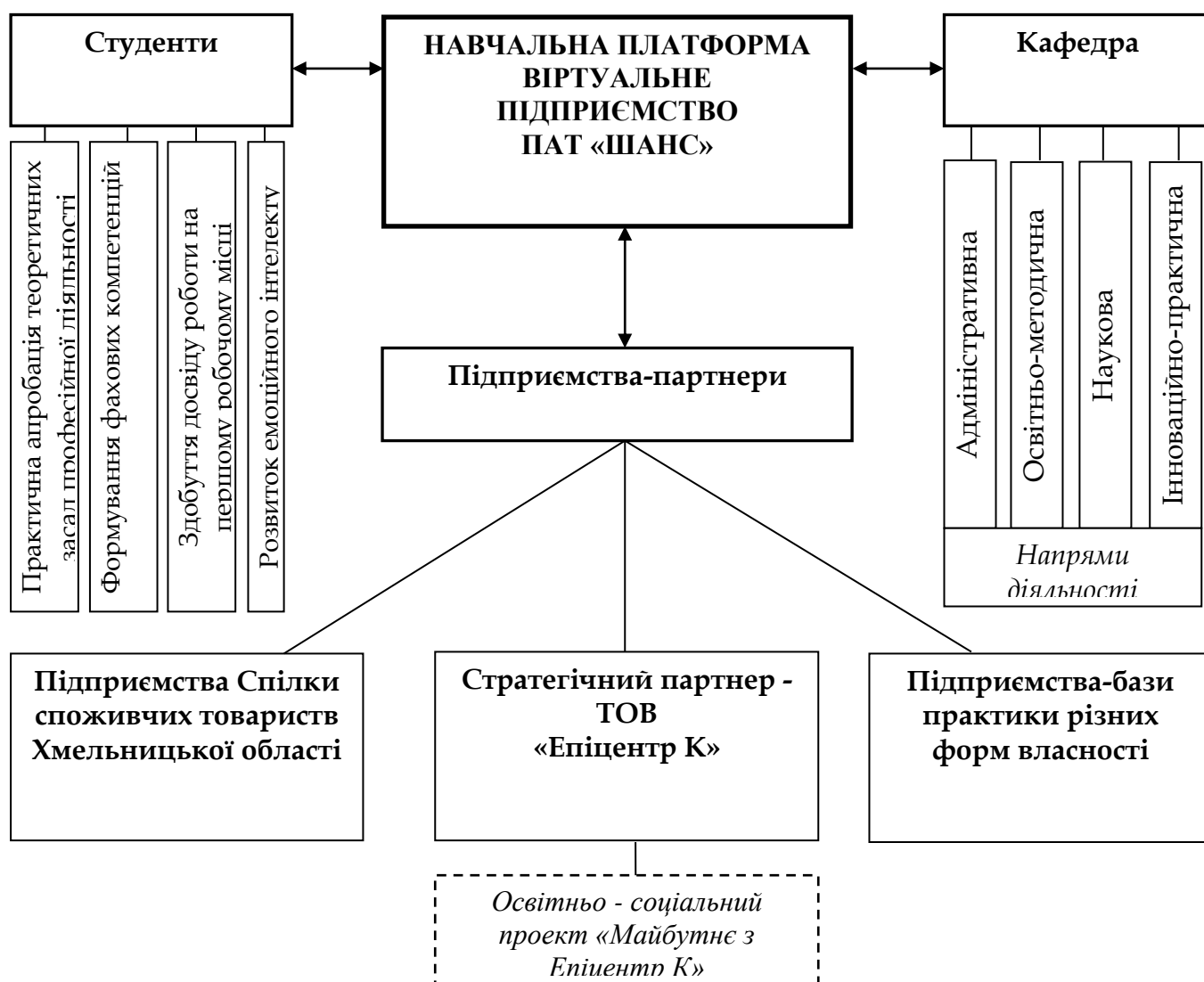
Рис. 1. Схема інтеграції ланок «наука-освіта-виробництво» на основі навчальної платформи

Віртуальне навчальне підприємство як інноваційний освітній інструмент ХКТЕІ – це навчальна платформа, діяльність якої побудована на бізнес-кейсах (змодельованих наскрізних ситуаціях), які виникають у фаховій діяльності і реалізуються у формі ділової гри, бізнес-тренінгу, бізнес-проекту тощо (навчальна платформа діє з 2005 року). Організаційна структура віртуального підприємства ПАТ «Шанс» ХКТЕІ відображена на рис. 2.