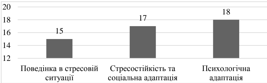
Рис. 1. Середні значення емоційної стабільності

Результати, представлені у таблиці 2 та на рисунку 2, свідчать про те, що рівень усіх показників емоційної стабільності у досліджуваних є досить високим. Це означає, що більшість учасників володіє високим рівнем психологічної стійкості й здатністю зберігати емоційну рівновагу у різних життєвих ситуаціях. Такий рівень емоційної стабільності сприяє зменшенню ризиків виникнення психоемоційних розладів і є важливим чинником для якісної адаптації та підтримки психологічного благополуччя у складних умовах міського життя.