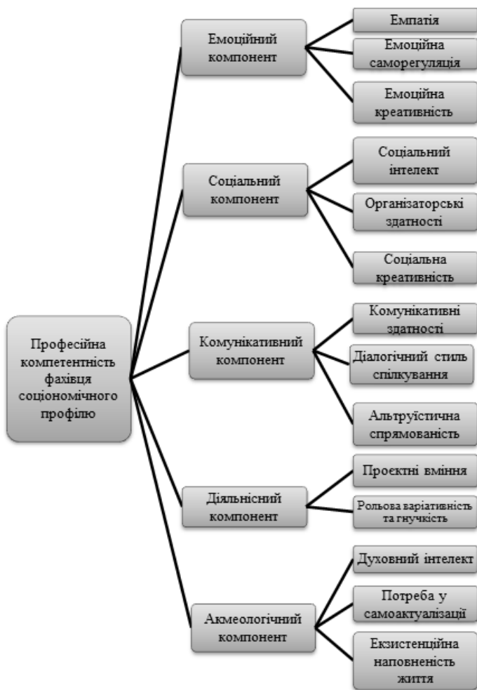
Рис. 2. Теоретична модель професійної компетентності фахівця соціономічного профілю.

Так, окремого розгляду вимагає емоційний компонент, адже соціономічний напрям роботи передбачає спілкування з людьми, що супроводжується переживанням різного роду