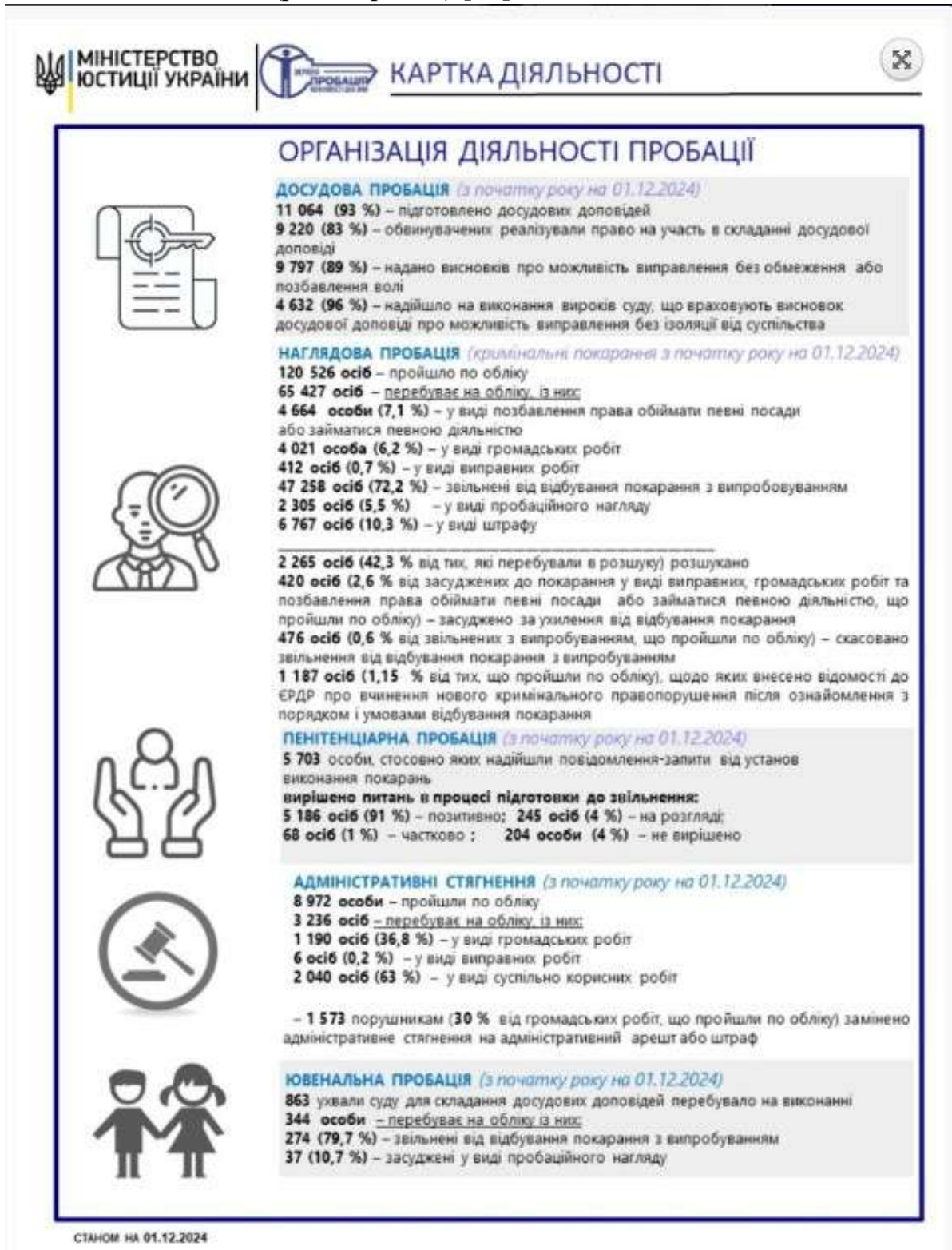
Рисунок 1 – Інфографіка «Карта діяльності» ДУ «Центр пробації». Організація діяльності.

свідчить про те, що цей підхід на практиці важко реалізувати. Доволі красномовно про це представлено інформацію у виді інфографіки на сторінці офіційного сайту Державної установи «Центр пробації» у розділі «Пробація в цифрах» станом 01.12.2024 (рис. 1, рис. 2) [10].