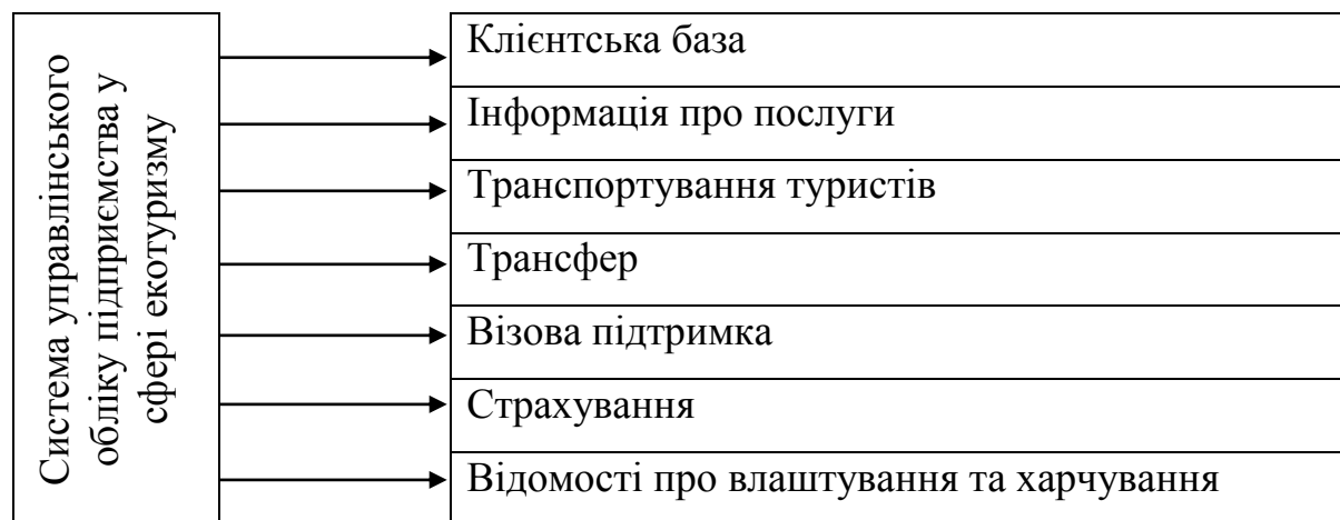
Рисунок 1. Структурування інформації в системі управлінського обліку туристичного підприємства

На відміну від регламентованих стандартами і законодавством фінансового та податкового обліку, управлінський облік ведеться відповідно до потреб в інформації менеджменту підприємства. Враховуючи особливості в управлінні бізнесом, структурі бізнес-процесів, організаційної структури, в системі перерозподілу і передачі відповідальності, побудова системи управлінського обліку на підприємстві повинна відповідати обраній концепції його організації, стратегічним напрямом вдосконалення внутрішнього обліку, передбачати повну реалізацію функцій управління. Інформаційну структуру управлінського обліку в туристичному бізнесі можна представити у вигляді рис. 1. Вона розробляється обов'язково з урахуванням двох аспектів: методологічного та організаційного.